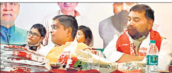
असम प्रदेश के वरिष्ठ जदयू नेताओं की बैठक में जदयू के राष्ट्रीय सचिव और असम प्रभारी राजीव रंजन प्रसाद व अन्य।

पटना। जदयू के राष्ट्रीय सचिव और असम प्रभारी राजीव रंजन प्रसाद ने कहा है कि जदयू को असम के पांच महत्वपूर्ण दलों की पंक्ति में खड़ा करना हम लोगों की पहली प्राथमिकता है। समाजवादी विरासत के साथ नये उपलब्धियों के आधार पर पवित्र का रोडमैप हम लोग बनाएंगे। असम प्रदेश के वरिष्ठ जदयू नेताओं की बैठक में उन्होंने यह बातें